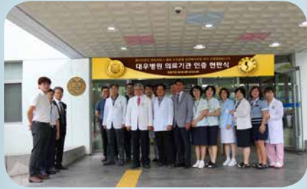
2016년 의료기관 인증획득 기념