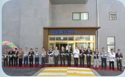
2012년 건강증진센터 개소식